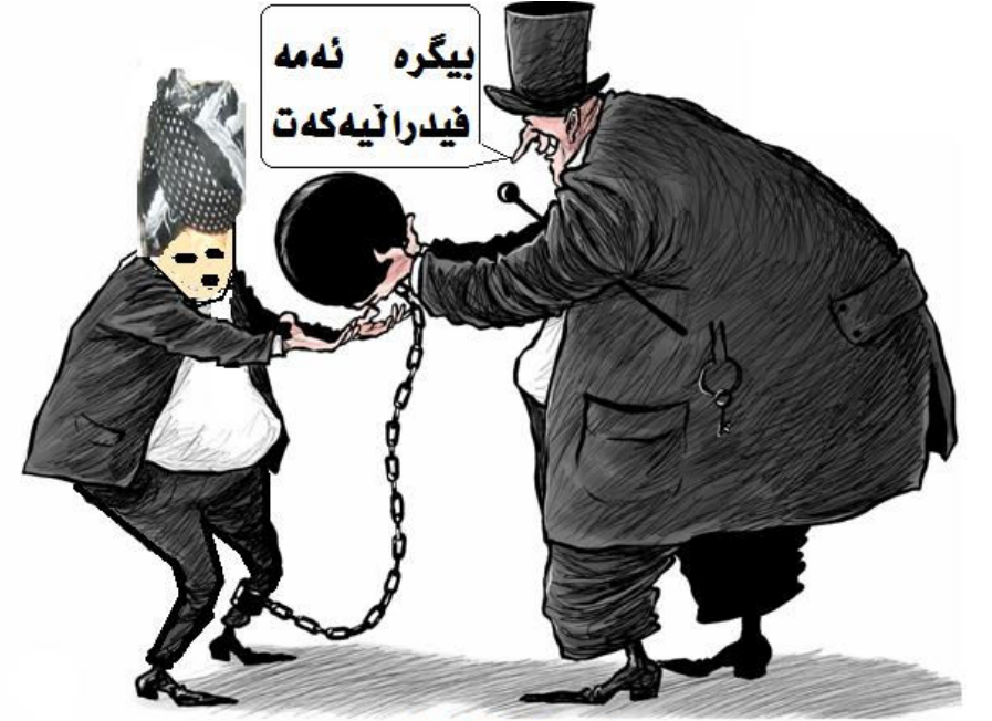
دیاری سالی 2009

هۆشیار زیاری وه‌زیری ده‌ره‌وه‌ی عیراق له‌گه‌ل هاوتا تورکیه‌که‌ی رایانگه‌یاندا کە هه‌رسێ ده‌وله‌تی عیراق، تورکیا و ئەمریکا ریکه‌وتوون تا مه‌له‌ندیکی هاوبه‌ش به‌مه‌به‌ستی کۆکردنه‌وه‌ی زانیاری له‌سه‌ر چالاکیه‌کانی پارته‌ی کرێکاری کوردستان له‌ شاری هه‌ولێر دا به‌هه‌زینن. له‌لایه‌ن خزیه‌وه‌ عه‌لی باباجان وه‌زیری ده‌ره‌وه‌ی تورکیا جه‌ختی کردوووه‌ کە گه‌شه‌پێدانی په‌یوه‌ندی و هاوکاری له‌نیوان عیراق و تورکیا پێنده‌ به‌ به‌هاوه‌نگی دژ به‌ چالاکیه‌کانی پارته‌ی کرێکاری کوردستان کە پیکه‌ی سه‌ره‌کیان له‌ باکووری عیراق دایه‌!!! چاودیزان ئەمه‌ به‌ ترسناک بۆ سه‌ر داهااتوی ره‌وشی کوردستان لیکده‌ده‌نه‌وه‌..