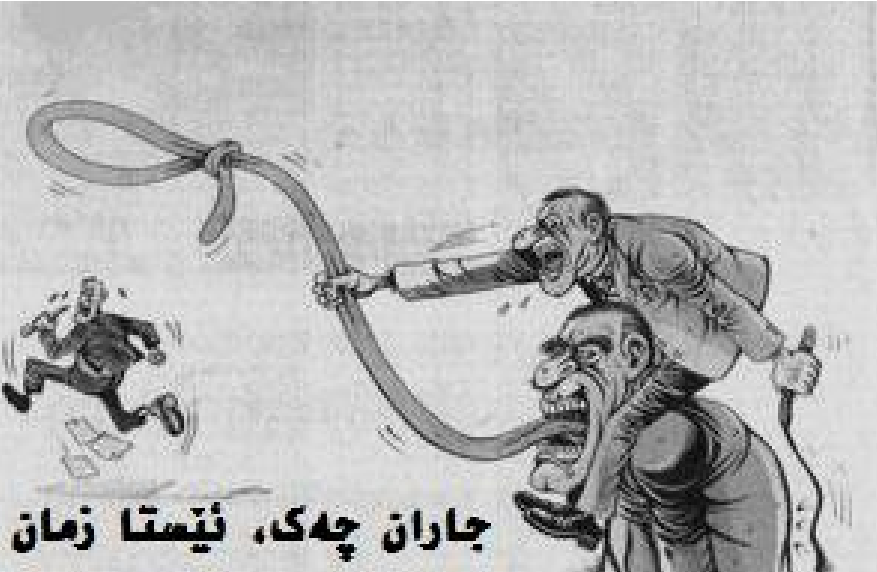
جاران چه ک، ئیستا زمان

به گویره ی راپۆرتیکی سایتی Cpj که میژووی کورزانی رۆژنامه نوسانی له ماوه ی 25 سالدا له 5 ولاتی دنیادا ئاشکرا کردوه، عیراق پله ی یه که می هه یه و له نیوان سالی 2003 تا وه کو 2006 زۆرتیرین ریزه ی کورزانی رۆژنامه نوسانی تییدا روداوه که 92 رۆژنامه نووس له عیراقدا کورزاون. راپۆرتکه رونی کردوته وه که له گه ل هه لگیرسانی جهنگی شهامریکا دژ به عیراق سالی 2003 ته نیا 14 رۆژنامه نووس کورزان، سالی 2004 ژماره ی کورزراوان گه یشته 24، له سالی 2005 دا 22 رۆژنامه نووس کورزراوان و له سالی 2006 دا 32 رۆژنامه نووس کورزراوان. هه ر به گویره ی راپۆرتکه ده رده که وه که زۆرتیرین رۆژنامه وان له عیراق ده کورزین، به مه شه ترسناکترین شوینه بۆ رۆژنامه وانان