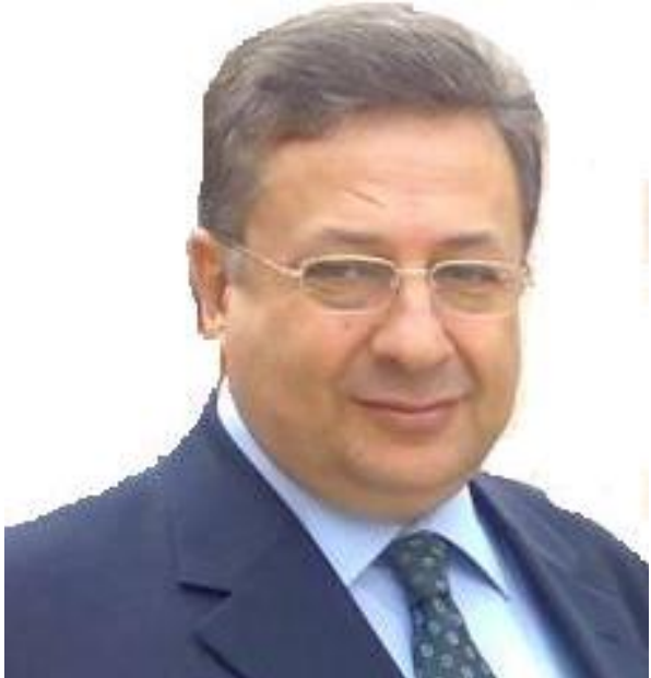
تورکمانی شاره‌کانی کوردستانی بانگه‌شیت کردوه، له‌ وه‌یه‌که‌دا سلاوی حکومه‌ت و گه‌لی تورکی به‌ ئامابه‌وان گه‌یاندوه و پینراکه‌یاندوون که حکومه‌تتی تورک پشیتوانیان

لینده‌کات، هه‌روه‌ها داوای لیک‌دروون که ده‌بێ تورکمانه‌کان زۆر به‌ چری به‌ شاداری له‌ هه‌لبژاردنه‌کاندا بکهن و ده‌نگی خۆیان و لایه‌نگرانیان به‌ کار به‌ینن!! به‌لام به‌هۆی باران بارینه‌وه ئاهه‌نگه‌که وه‌ک پینووست ته‌واو نه‌کراوه و ئه‌و برگانه‌ی بۆی داندرا‌بوون پینشکه‌ش نه‌کراون. جیگه‌ی ئامازه‌یه که تورکیا له‌ ریگه‌ی جۆراوجۆره‌وه ده‌ست له‌ کاروباری ناوخۆی هه‌ریمی کوردستان وه‌رده‌دات. به‌گۆیه‌ی زانیاریه‌کان هه‌سه‌ن عه‌ونی ماوه‌یه‌ک له‌مه‌وبه‌ر دیداریکی تایبه‌تی بۆ ژماره‌یه‌ک له‌ به‌رپرسیانی وه‌زاره‌تی هه‌روه‌وه نوێنه‌ری لایه‌نه‌ تورکمانیه‌کان ریکخه‌ستبوو، له‌وه‌ی