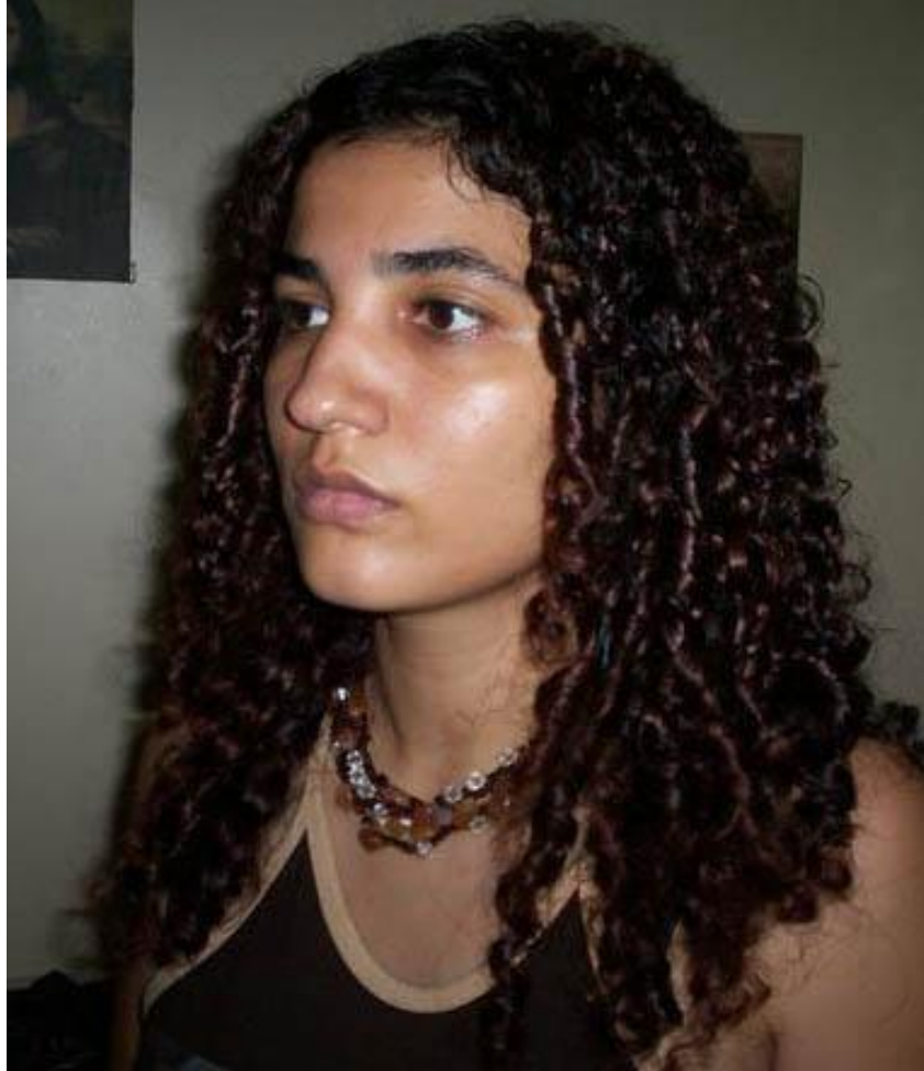
هەدوان، بەهۆیهوه کوردی فێربووم. پ: کاه سال؟ وہلام: دەتوانم بلیم سالی ۱۹۹۸. لەو دیداردا دیلبر هیما جەختی

هۆین دەبیته باران، دەنەفشیانی بە دلۆیان چاوه‌کانی ئاسکی ئاسک لە وشک بوونەوهی هۆی موکڕ دێ. هۆین دەبیته ژهر بە قژی مەدوسا وەدەدا دەگری سەرنجی بن زهوی. هۆین دەبیته دەریا لە فەونەکانی ئاریدا کەفز دەگری لە دەقەکانی دایک لە شەوهەکانی بی کۆلان کەپێنی کەپک دەدزێ، ئاسکی سەرسام لە میاتی وشە گوتن ئەستێرە لە ئاسمانان نامێنی دلی کەپکی دلبر لە مایگی وێران تەفشان دەبی و لەبەر دەم مەدوسادا هۆریزی ژیان دەبولی باران لە دواي هۆیهوه جێ دێنی وشک بوونەوهی هۆی لە شاران بار دەکات ژهر هۆی بە بارگرانی ولاتی سورگۆل (ژهره‌وهی دەکات.)