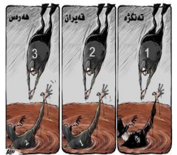
به ده ستکاریه وه له رۆژنامه ی شرق نه لئه وه ستا وه رگیا و

دوین شهمه، ریگه وتی ۱۸-۱۰-۲۰۰۸ به هه زاران عیراقی له سه ر داوی موخته دا سه در رژانه سه ر شه قامه کان و دژ به مانه وه ی هیزه کانی ئه مریکا بۆ ماوه ی سی سال له عیراق ناره زایی خویان پیشاندا. لایه نگرانی ره وت سه در له کاتی کدا ئالای عیراقیان به رز کردبووه و به لی به لی بۆ عیراق یان ده گوتوه، ئاگریان له ئالای ئه مریکایان له ژیر پینا و به به رچاوی په یامینزانی که ناله کانی راگه یاندنه وه ئاگریان له ئالای ئه مریکا به ردا. شه جمه ده مه سعودی په رله مانتاری ره وتی سه در به ناژانسی رۆیتسه رزی راگه یاندوو که ریپیوانه که هیمانه یه داوی ده رچوونی هیزه داگریکاره کان دهکهن و ده خوازی که حکومه تی عیراق شه و ریگه وتنه له گه ل واشنگتن مۆر نه کات. چیگه ی ئاماژه یه که به رپرسیکی ره وتی سه در ئاشکرای کردوو که نوری مالکی سه رۆک وه زیانی عیراق ره زامه ندی خۆی له سه ر شه ریپیوانه دابوو. هه ربۆیه ش هیزه کانی پۆلیس پاریزگاریان لیده کردن.