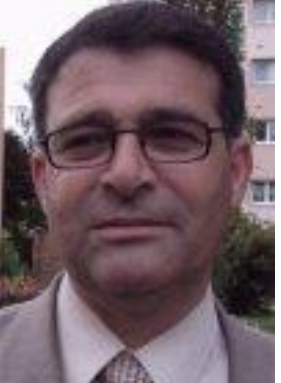
له لایه ن هیره کانی ناسایشی سو ریا وه ده سته گیرکراوه. ره وتی ئایینده ی کورد له سو ریا له راکه یاندراره که دا

ویسرای ئه وه ی که دوا ی ئاشکرا کردنی چاره نووسی ناوبراوی له ده سه لاتدارانی سو ریا کردوه، هیواشی خواستوه تا سه رجه م هیز و کۆمه له و ریکه خراوه نیوده و له تیه کان گوشار له سه ر رژی می سو ریا دابن و ژیا نی ئه و سیاسه ته دارو چالا کانه له مردن رزگار بکن. جیکه ی ئاماره یه که ته مۆ سیاسه ته داریکی ناسراو و چالا کوانی ریکه ی مافه کانی گه لی کورده، به وه زیه شه وه چه ندین جار له لایه ن سو ریا وه زیندانی کراوه.