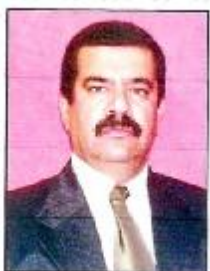
نه سه ده عه لی نه جه ده * نه دازیار له فه مانگی ناوی پاریزگای که رکه ک

خوری کم بوته وه وه کو تیشکی (گاما، بیتا، سه ره وی وه نه وشه یی و خواری سور... هتد) که دهنه هزی په یدابوونی چه ندین نه خوشی پیس و خراب له شه شی مرؤقه کاندا، ترسانکترینان نه خوشی شیرپه نجه یه، پیس کردنی ناوه وا له لایه ن خودی مرؤقه وه دوژمنایه تی کردنه له گه ل خود واته دوژمنایه تی کردن و له ناوادنی سه رجه م کومه لگه ی مرؤقایه تی یه، نه و پیس کردنه ش به چه ندین ریگای نایاسایی و نازانستیانه له لایه ن مرؤقه وه نه جام دهریت وکو به رپا کردنی جه نگی گوره و به کارهینانی ده یان چه کی کوشنده ی گوره ی وکو چه کی ناوه کی و کیمیایی و هیشوی، یاخود به فریدانی ملیزان ته ن پاشه رزی پیس له سه ر زه وی، یاخود خسته دهریا و دهریا چه کانه وه، وه یان دانانی کارگه ی به ره مه نه وتی و گازیه کان له نریک ژینگه ی مرؤف، هه موو نه وانه ژینگه پیس ده کهن و سه رنه جام ژیانی خه لکی له جیاتی ناسوده یی و به خته وه ری، ره ش پؤشی و دل ته نگی و ناآرامی بالی به سه ردا ده کیشی... شاره گه وره کان ۱) دروست کردنی ریخراوی مه دنی سه ره خؤ دژ به جه نگی و به کارهینانی چه کی کومه ل کوژ وک (نه وتومی و کیمیایی... هتد). ۲) هه ر نه و ریخراوانه تیکوشان بکن له پیناوی دوورخسته وه ی کارگه و نه و دامه زراوانه ی که له نریک شاره کانن و دهنه هزی پیس بوونی ژینگه.