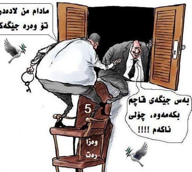
به داوا ی بووردن له هونه ره مند، ده ستکاری کراوه

ئه حمه د حبول که ئیستا دۆسیه ی ئه وه ژنه ی له ئه ستر گرتوووه ئاشکرای کردوه و که ئه وه دیپلوماتکاری عیراقی بالیۆزخانه ی عیراق له ئورده ن ره وش ی ده رونی ژنه که ی قۆزتۆته وه، له وه لاگادار بووه که تازه له شووه که ی جیا بۆته وه، له کاتیکدا که شووه که ی پیشووی ئه وه ژنه دیپلوماتکاری دیکه عیراقیه و هاویری ئه وه که سه یه که ده سدریژی کردۆته سه ر ژنه ئورده نیه که.