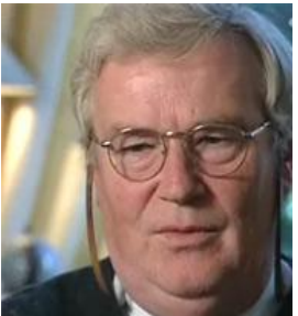
بىرپاروايى ۵-۹-۲۰۰۷ چوارشەممە، ۹-۵-۲۰۰۷ دانگەى لاھى ولاتى ھۆلەندا دوايىن بىرپارى خۇى سەبارەت بە تۆمەتبار فرانس قان ئانرات

بازرگانى چەكى كىمىاوى بدات. شىاوى باسە فرانس قان ئانرات بەتۆمەتى بازرگانىكرىن بە مادەى كىمىاوى و فرۆشتنى بە سەرانى عىراق تاوانراوھە ، بەو ھىزەشەوھ دانگەيى كرابوو، سزاي ۱۵ سال زىندانىكرىنى بەسەردا دراووو. بەبۆنەى دەرچوونى دوايىن بىرپارى دادگە بىرپار وايە لەسەر داخووزى ناوھندى چاك كوردستانىيانى دانىشتووى ھۆلەندا لەبەردەم دانگەى لاھى كۆبىنەوھو رىپىوان بكەن و كۆى لە دوايىن بىرپارى دادگە بگرن .