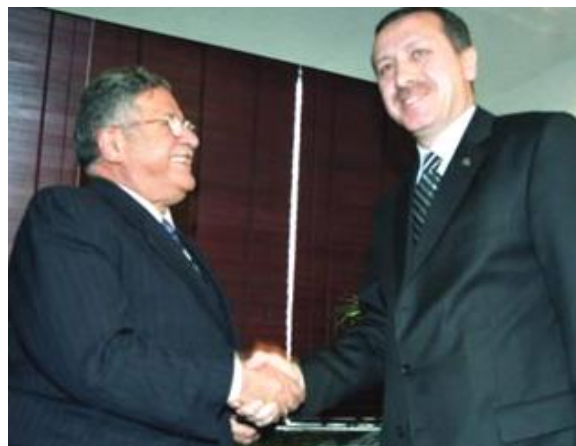
عیراقی هه‌یه‌یه‌یان نا؟! فی‌ل کراون یان نا؟! دیموکرافیا‌ی که‌رکوک ده‌ستکاری کراوه‌و

ته‌یب ره‌جبه‌ ئه‌ردۆگان ، سه‌رۆکوه‌زیرانی تورکیا له‌پێوه‌ندی دیدار له‌گه‌ل ریزدار سه‌رۆک تاله‌بانی ، سه‌رکۆماری عه‌یراق که‌له‌شاری ریازی عه‌ره‌بستانی سه‌عودی په‌کتریان دیتوو ، ئاشکرای کردوه‌کاتی سه‌بهرت به‌که‌رکوک نیکه‌رانی خۆمان دیارکرد ، سه‌رۆک تاله‌بانی پینگوتین : ئه‌گه‌ر گومانتان له‌ناسنامه‌ی که‌رکوک هه‌یه ، ئیوه‌ده‌توانن شانیدیک بنیزنه‌که‌رکوک و لیکۆلینه‌وه‌بکهن ! ئایا له‌هه‌وله‌کانی چاره‌سه‌ری کیشه‌ی که‌رکوک هه‌له‌ی