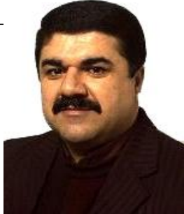
دورسیم دیبه گهلی

سیاسه تى به عس نه پوهله کورده ستاندا! دا دودى ليکونکي وه هم موو قسه کاني (تاریق عزیز) ايان به سه دماو تاوانباره کاني تر گو تيو وه موله پيتاوى دانپندانى نه اوتيش به تاوانانه ي کسه رانى به عس له کورده ستان و نيراقا نه نجايان دابوو. نه دانپندانى نه تى تى اووى سهرانى به عسو سه دماى يزار کردبوو. بويه کاتيک کسه دماو پيرى روى ره شى پينجشمه (۱۷,۷,۲۰۰۴) دا له دادگايى بالاي تاوانه کاني نيراق کله و ژوډا (۱۲) تاوانبار له سهرانى به عس بردرانه برده دماو. تاريخ عزيزى بينسو چاوه کاني لس سورکردبوو وه پي گو تيوو: (الم تکت مسؤل ولا عن شى ولا علاقه لک بشى؟ يا کلب، يا خائن!.... واته: به پيرى نه بوى له هيچ شتيکو پيوه نديت به هيچ شتيکه وه نه بوو؟ هى سگ، هى ناپاک!....) دوى نه جنيوانى سه دماو، تاريخ عزيز به خوزدا ده چيته وه هولى نه وه ددات که به ربه رمله دانپندانه په شيمان بيته وه. پاشان له (۱۹,۹,۲۰۰۵) دا تاريخ عزيز له لايه ن دودى (د.ب.ت.ع) دا ليکونکي وه له گه ل دهرکيت بائامدوبوونى (به ديع عارفى پاريزه رى به مبه ستي په سندرکرنى روونکرده وه کاني وه کو شايه تکت، له و نيشته دا تاريخ عزيز له سر زورش به شيمان بوته وه، به لام له وه لامى پرسيارى: ثابا چارهنوسى نه خيزانه کورده نه ي کله سالى (۱۹۸۸) دا له لايه ن هيزه کاني سوپاى نيراقى، و به تايه تى شالووه کاني نه نغالى ده ستگيرکران چيان به سهرات؟ ده لپت: له و گتو گزيانه ي که عى حسن مهجيد سه رپرشتى ده کرد، پرسيارى چارهنوسى نه خيزانته و زياته کاني ليکرابوو، به لام نازم وه لامى عى حسن چى بوو! له دانپيشته هاو به شه کاندانه ئيه که شينره يککي تتيک که حکومت (حکومتى پيشورى روخا) قهر بوى زيان ليکوتوه و کورده کان