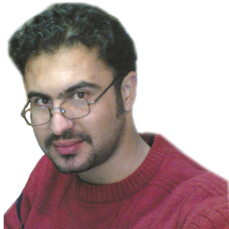
سەرکەوت جەمە خورشید ساڵی 1979 لە شاری سلێمانی لەدایک بوو. گەنجییەکە بەرھەمەندە دەتوانین لەدوو روانگەوێ هەئێ