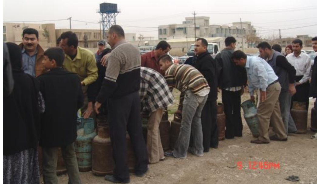
قهيرانى سوتهمه ني به ره و كوئى...!!

سوتهمه ني بهيئين، ههروهه ها به نزينى ټيره ش دهكرين و دهفروشين، نه و شوځيزانه ي كه به نزين له به نزيخانه كان ودره دگرن و له خويان زياده، دهفروشنه وه به ټيمه. يان چهنده شوځيزيك كرويانه به پيشه بومان دينن به نرخيكي كه متر لييان دهكرينه وه نرخي به نزين به پي روژه، ههروهه ها بهرزه نزمي نرخي به نزيخانه كانيش دهور دهيين بارو دؤخيش نرخ دهگوريت تا ټيسه ليمان نه پرسراوه ته وه بوچي دهفروشين، ده بي حكومت مهنونيشمان بيت زور ترين كيشه ي هاولاتيانان لي دور خستونه توه لاوك خاليد/ به نزين فروش به نزين له ټيرانه وه بومان ديت زور جاريش له كهركو كه وه، جگه له به نزين نه وتيش دينن هه ندي كاتيش به نزيخانه كاني ټيره ش پيمان دهفروشنه وه، يان شوځيزه كان كه له خويان زياد بو به ټيمه