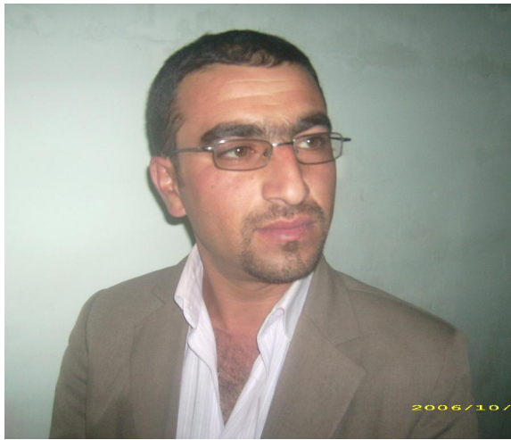
خۆی ده سه لمیتی و فیرمان ده کات به خۆیه وه له هه موو شته کانی تر بروائین. به لام

بۆ ئه مجاره یه کیک له و شاعیرانهی که هه میسه له نیو دنیای فراوانی شیعره خه ریکی گه رانه به دوی مانا کانی عه شقدا. به پیوستمانزانی زانا سامان بیدوینین چه نند پرسباریکی ئاراسته بکین پ/ ئاجه ند توانیونه شاعیر بوونی خۆت بسه لمینی؟ و/ وهک ئه وهی به ریزتان پرسباری لیه ده که ن که گوایه تا چه ند توانیبتیم شاعیریتی خۆم بسه لمینم. به راستی ئه مه ده که ریتیه وه بۆ ئه وانسه ی خویته ری شاعیره کانمن. به لام ده بیت ئه وه م له یاد نه چیت له نیوان شیعو شاعیریه تیدا فهزایه کی نادیار ههیه ئه ویش ده بیت خوودی ئه وه که سه ی خۆی له شیعره دا دۆزیوه ته وه. بگهریت بۆ دۆزینه وهی، یان به