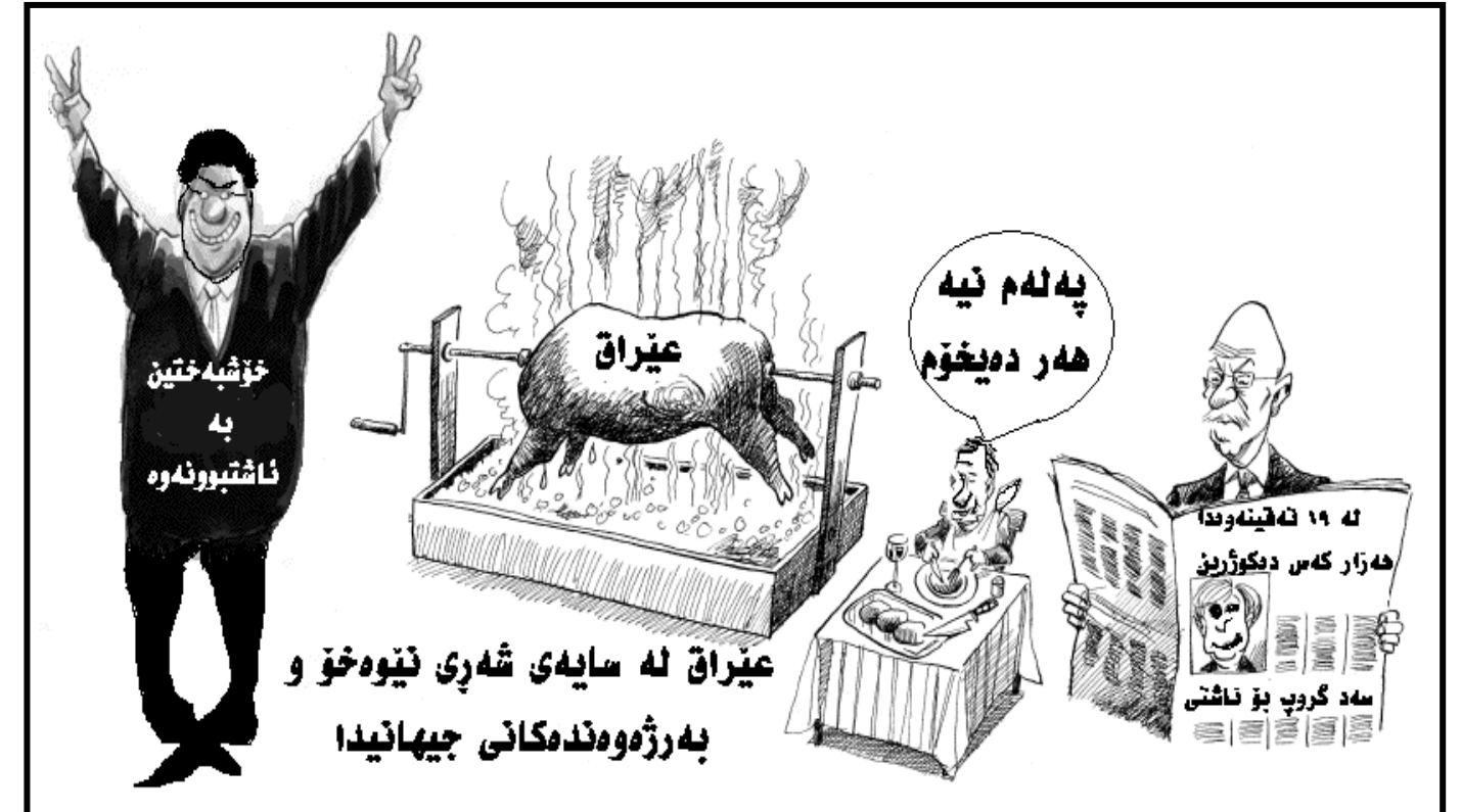
عێراق لە سایە ی شەری ئیوہخۆ و بەرژوونەکانی جیھانیدا