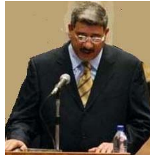
لەلایەکی دیکەشەوه داوای کردووه تەواوی بازگەکانی ئەو ناوچەیی

هەلگیرین، بەلام ئەفسەرانێ لیواکە لەوه دانیابوونە ئەگەر بازگەکان هەلگیرین مەفرەزەیی تیرۆریستان بە ئاسانی لەناوچەکەدا ھاتوچۆ دەکەن و کاری تیرۆریستی ئەنجام دەدەن، داواکەیان جیبجیبی ئەنجام نەکردووه، سەرەنجام ناوبراو بەنێگەرانی و توورەیی گەراوتەوه بۆ بەغداد.