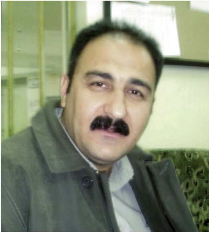
شانوو هونه رم کردۆته پیشه و ریچه کی ژبانی خۆم له سه ر دارشتوه بۆیه نازانم چه دره م نه گه یشت به چی به لام (سایکلۆژیا) و ناسینی که سیتی و هونه ریشدا چه زم له بواری

*گه ر شاکار نه بوو بیا به چ بوارت که هه له بۆزاره؟ و: دیاره به چه زو ئاره زووی خۆم